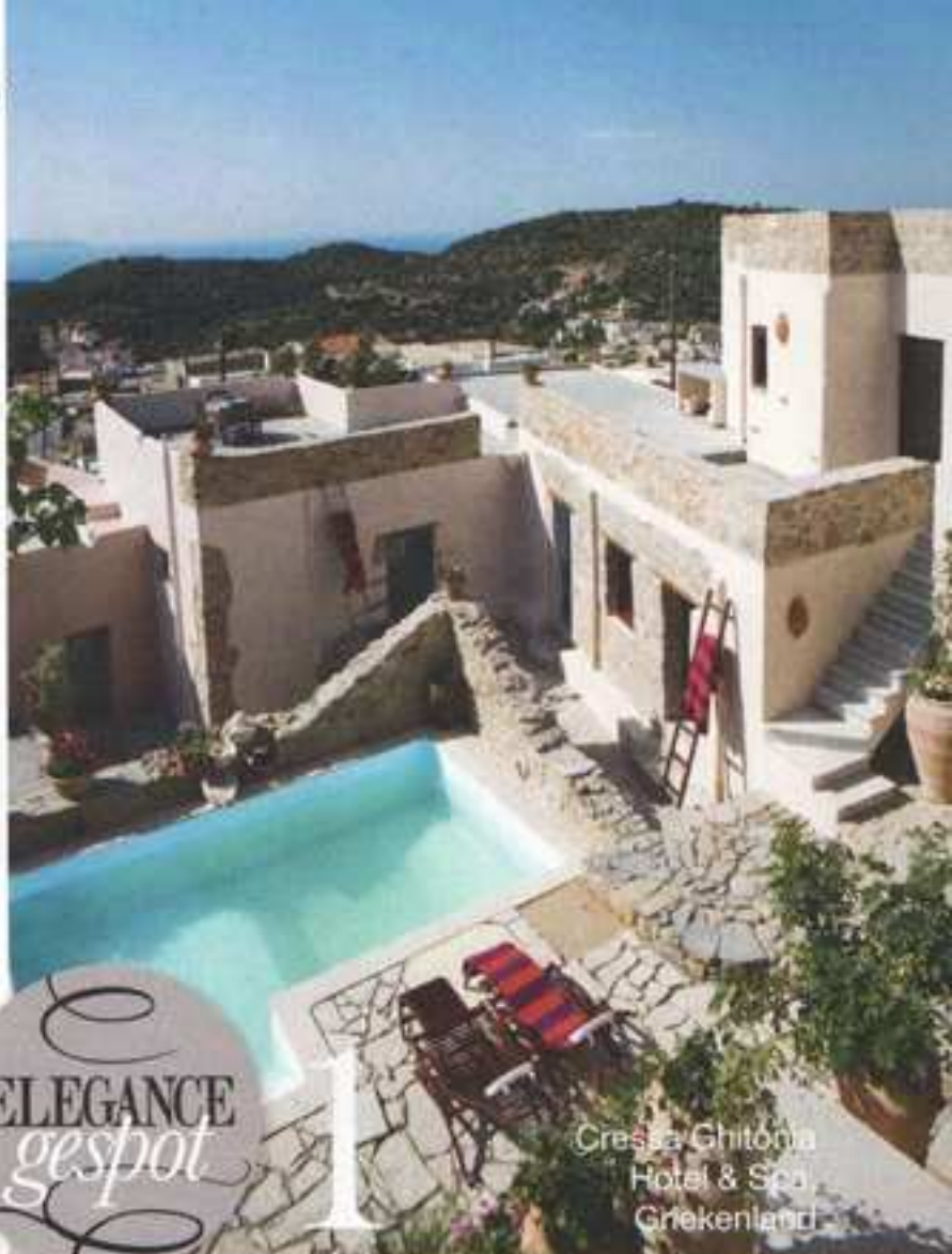
Cressa Ghitonia Hotel & Spa Griekenland

3. Alle 10 suites van het Farol , een designhotel in het kosmopolitische Portugese plaatsje Cascais, hebben een spectaculair uitzicht op de oceaan. Ze zijn ingericht door Portugese modeontwerpers. Vanaf €228. www.farol.com.pt (boeken via www.designhotels.com ).