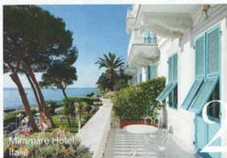
Miramare Hotel Italië

ans opgelet: er is een boek met ruim 200 foto's vol adembenemende resorts. Daarin komen bekende banen voorbij met trendy luxe hotels. heel veel foto's en details. Golf Resorts Top of the World Volume 2 , €49,90. www.teneues.com