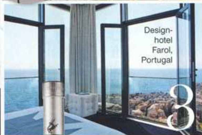
Design-hotel Farol, Portugal